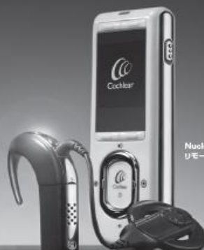
Nucleus 5 サウンドプロセッサ(CP810)