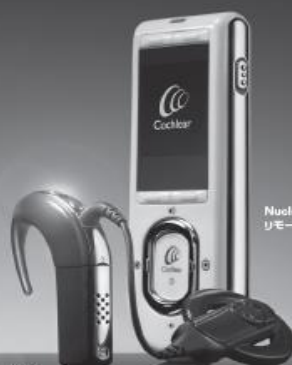
Nucleus 5 サウンドプロセッサ(CP810)